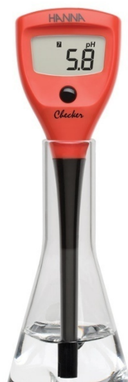
Рис. 2. Карманный рН метр

Так же возможно и изменение уже имеющегося уровня рН. Так, для изменения рН в «кислую» сторону можно добавить в воду кислоту (например, лимонную). Если же необходимо повысить уровень в щелочную сторону, то лучший способ для этого - использование арагонита. Это богатый кальцием минерал, его помещение в воду обеспечивает увеличение уровня рН и жесткости, но если такого нет в наличии, то можно использовать обыкновенную пищевую соду [6].