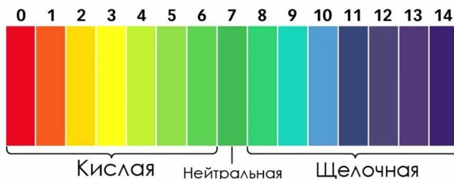
Рис. 1. Эталонная шкала рН

2. рН-метры – эти приборы стоят намного дороже, нежели лакмусовая бумага, и их использование требует специальной подготовки прибора, но при этом они обеспечивают точность измерений вплоть до сотых.