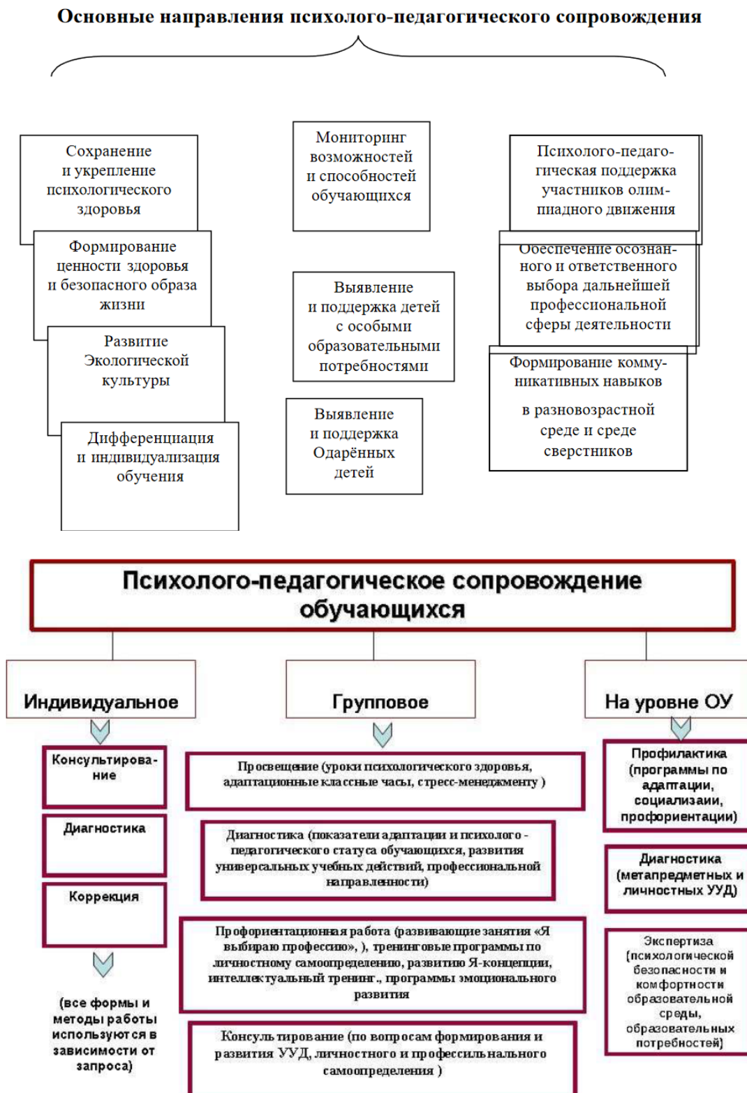
Схема 1. Основные направления психолого-педагогического сопровождения

Профилактическая работа с целью формирования у учащихся знаний, установок, личностных ориентиров и норм поведения, обеспечивающих сохранение и укрепление физического, психологического и социального здоровья, содействие формированию регулятивных, коммуникативных, познавательных компетентностей.